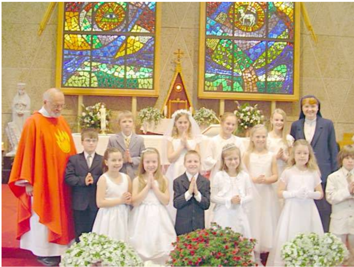
Su Pirmosios komunijos vaikais

– Jau 15-i metai gyvenu ir dirbaujuosi Lemonte. Tenka dar-