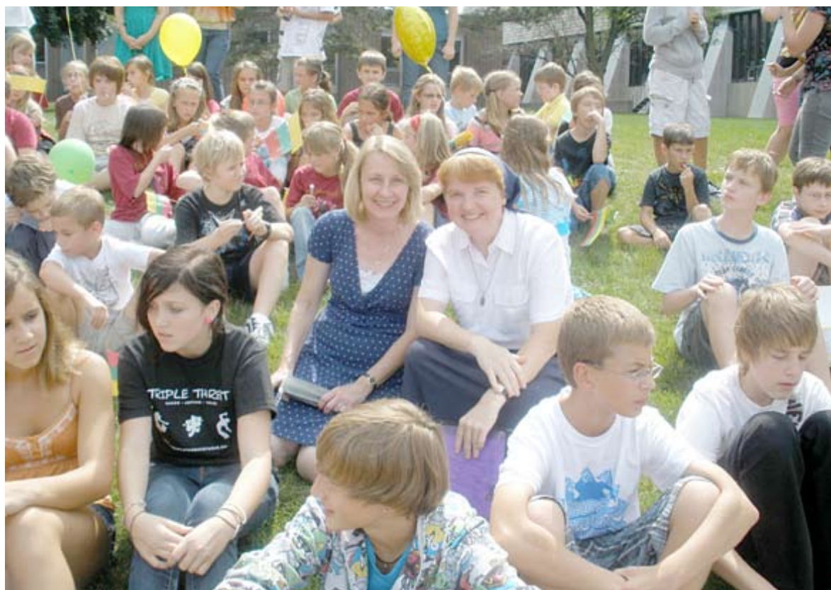
Tarp Maironio lituanistinės mokyklos moksleivių Lemonte

– Visiems visiems norėčiau palinkėti džiugios ir drąsios Vilties patikėti Dievo meile, atverti širdis ir išleisus Jį į savo gyvenimus skelbti Gerąją Naujieną, liudyti Dievo Karalystę čia ir dabar.