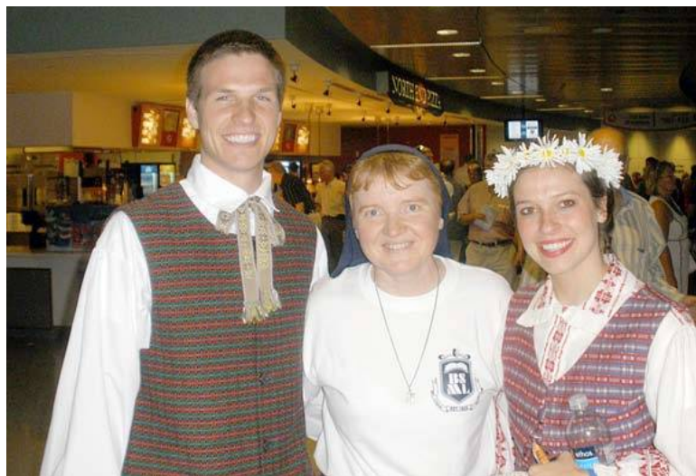
Su studentais šokių šventėje Bostone

– Kaip seselė vienuolė jaučiu, kad esu ne dėl savęs, o esu dėl Jo, esu dėl kitų. Tai ir yra mano didžiulis džiaugsmas bei laimė. Kiekviena diena yra Dievo dovana. Todėl ji ir prasideda su malda – asmenine ir bendra rytmetine. Dalyvavimas kiekvieną dieną šv. Mišiose yra nenusakoma palaima ir malonė, o Komunijoje priimtas Jėzus sustiprina ir lydi visą dieną, kiekvieną atliekamą darbą. Dažniausiai po pusryčių atlieku mąstymą – meditaciją (pokalbyje su Dievu klausau, ką man Jis nori pasa-