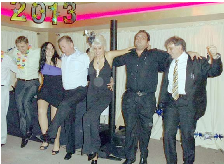
Naujuosius metus dalis lietuvių pasitiko „Nikos“ restorane

Dėl nepakankamo susidomėjusių žmonių skaičiaus atšaukti du renginiai – „Kunigaikščių užėjoje“ ir Willowbrook Bal-