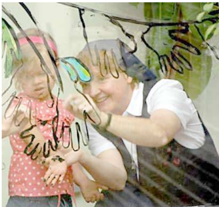
Kartu piešiame rankeles per Bendruomenės dieną Lemonte